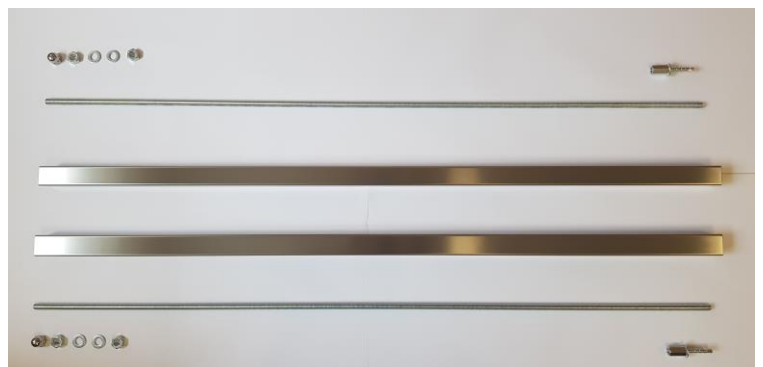
Vierkant - Blendrohre